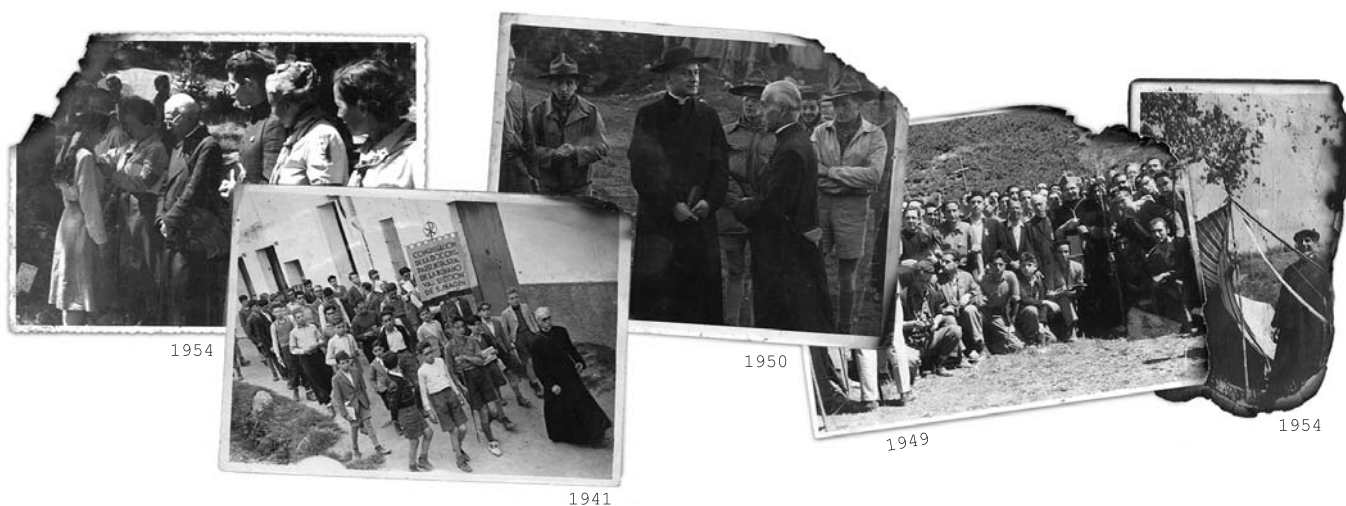
Recull de fotografies socarrimades a l'incendi del Casal de Montserrat