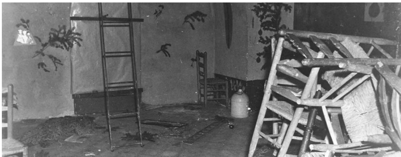
Pira de mobles preparada per calar-hi foc, i decoració nadalenca destrossada

Quan hi vàrem arribar el meu germà es va quedar al carrer on els caps de la seva unitat els esperaven i marxaren a fer l'activitat nadalenca a un altre lloc. Vaig pujar per les escales del Casal procurant no trepitjar les mànegues dels bombers, hi havia fum, al principal vaig trobar-me alguns companys que parlaven amb els bombers.